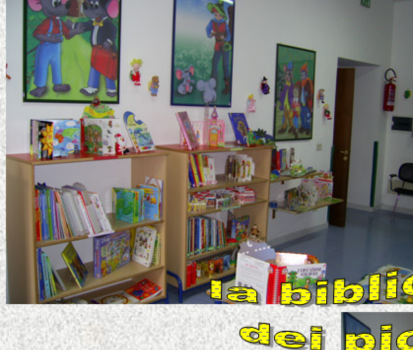
la biblioteca dei piccoli